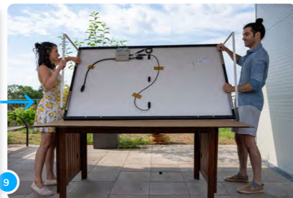
9 Tu peux maintenant retourner ton panneau...