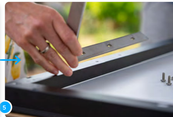
5 Positionne les trous du support et du panneau les uns sur les autres...