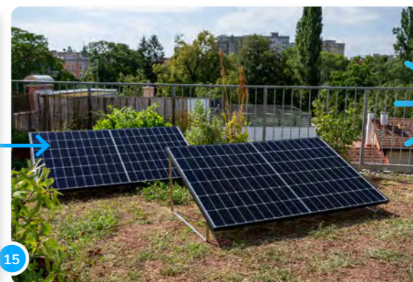
15 ...et même ajouter un autre panneau.