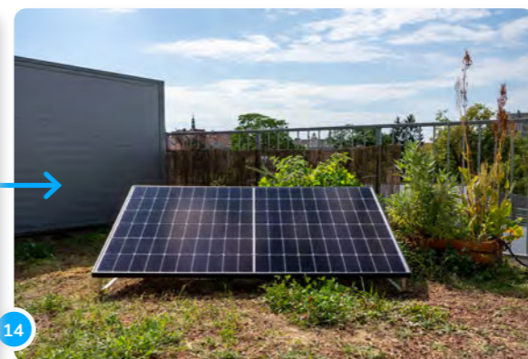
14 Tu peux maintenant profiter de ton électricité verte autoproduite...