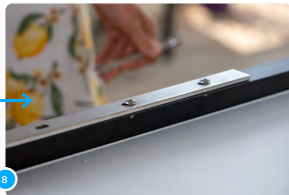
8 Voilà ce que ça devrait donner.