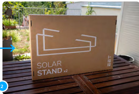
2 Si tu as opté pour les supports de sol, deux supports métalliques sont inclus dans ton colis.