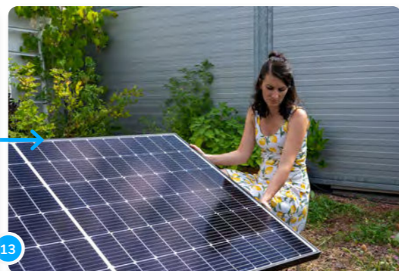
13 ...ou bien tu peux ancrer ton panneau au sol avec des sardines.