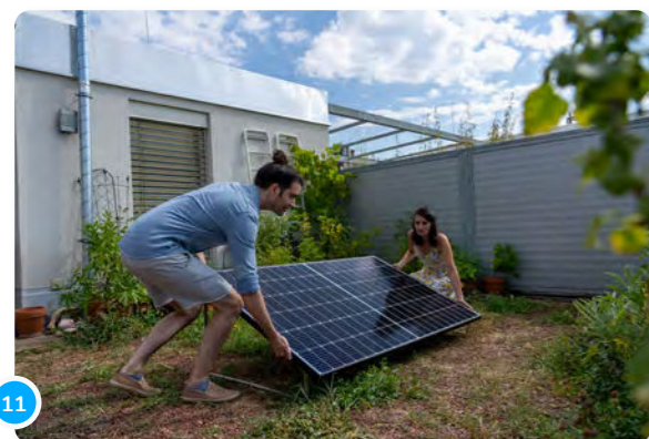
11 Quand tu as trouvé l'endroit adéquat, tu peux soit visser le panneau au sol...