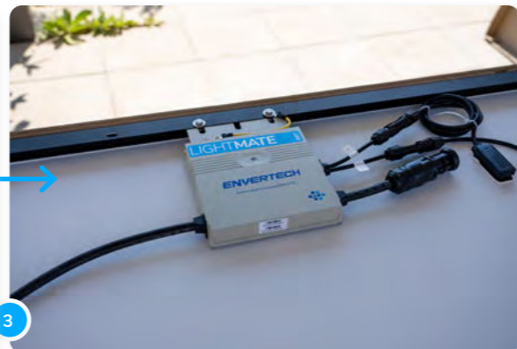
3 Pose ton ou tes panneau(x) avec le côté verso vers le haut sur une surface propre et lisse.