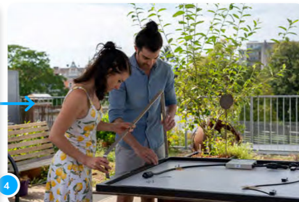
4 Au dos du cadre du panneau, tu trouveras des trous où tu pourras visser les supports.