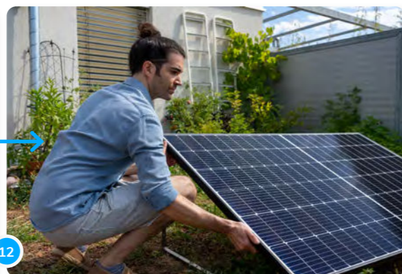
12 ...soit lester le panneau avec quatre dalles de béton de chaque côté...