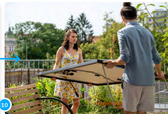
10 ... et le placer dans un endroit ensoleillé de ton jardin ou de ton balcon. Fais-toi aider pour cette étape!