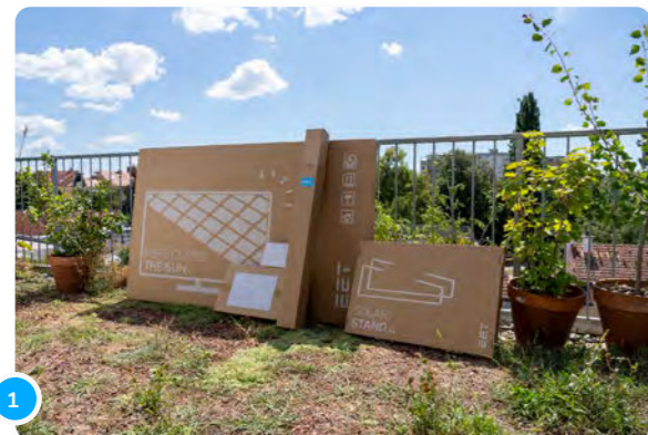
1 Panneau(x), onduleur(s) inclus, et supports de fixation au sol.