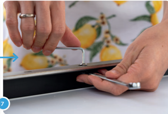
7 Ahora puedes fijar los dos soportes con cuatro tornillos y tuercas cada uno.