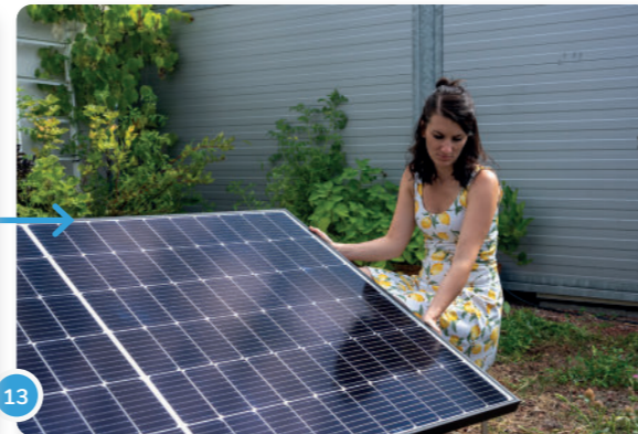
13 ...o puedes sujetar tu panel en el suelo con estacas de tierra.