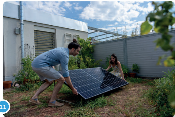
11 Una vez que hayas encontrado un lugar adecuado, puedes sujetar el panel al suelo con tornillos...