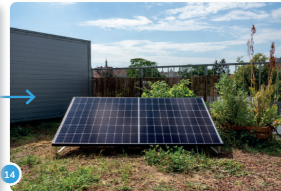
14 Ahora puedes disfrutar de tu propia energía verde generada por el panel solar...