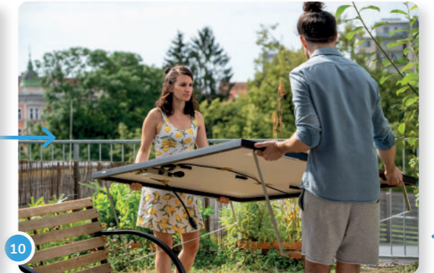
10 ...y llevarlo a un lugar soleado en tu terraza o jardín. ¡Por favor, pide ayuda para hacerlo!