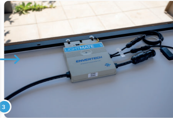
3 Coloca tu(s) panel(es) con la parte posterior hacia ti sobre una superficie limpia y lisa.