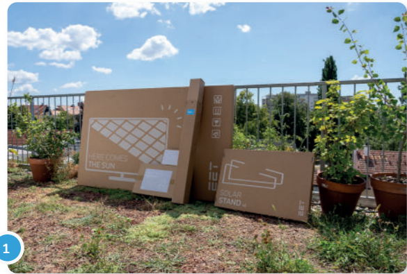
1 Panel(es) con inversor y soporte.