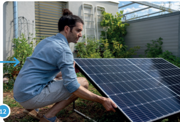
12 ... o puedes fijar el panel utilizando cuatro losas de concreto por cada soporte como contrapeso...