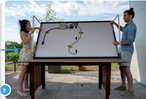
9 Ahora puedes voltear tu panel...