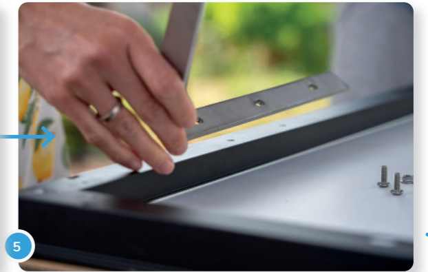
5 Posiciona los agujeros del soporte y del panel uno encima del otro...