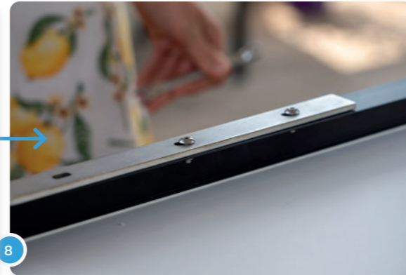
8 Debería verse así.