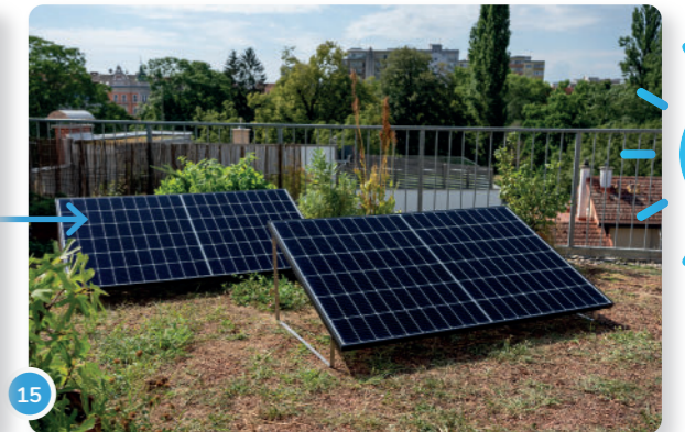
15 ...e incluso puedes recibir apoyo por otro panel solar adicional.