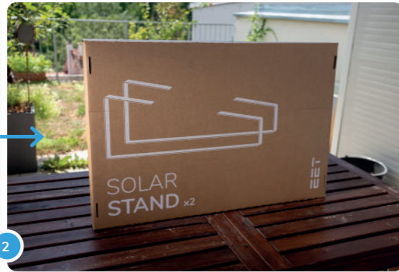
2 Si has decidido elegir los soportes, tu paquete incluirá dos abrazaderas de metal.