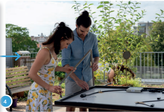
4 En la parte trasera del marco del módulo, encontrarás agujeros donde puedes atornillar los soportes.