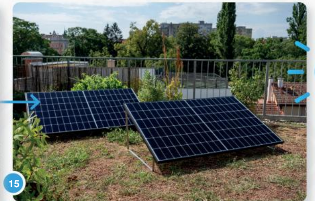
15 ...en laat u zelfs door een ander panel ondersteunen.