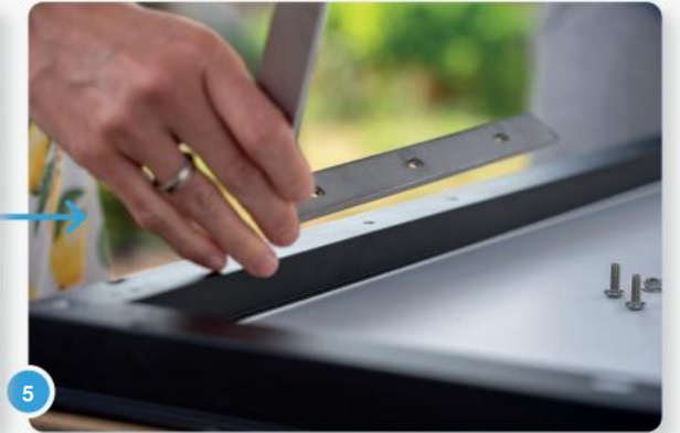
5 Plaats de gaten in de beugel en het paneel boven elkaar...