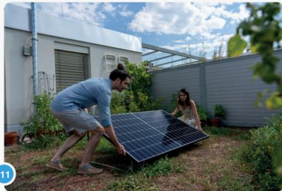
11 Zodra u een geschikte plaats heeft gevonden, kunt u het paneel op de ondergrond vastschroeven...