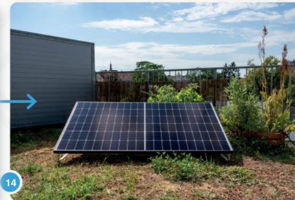
14 Nu kunt u genieten van de groene stroom die u zelf produceert...