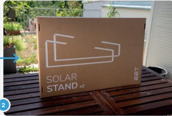
2 Als u voor de standaard heeft gekozen, bevat uw pakket twee metalen beugels.