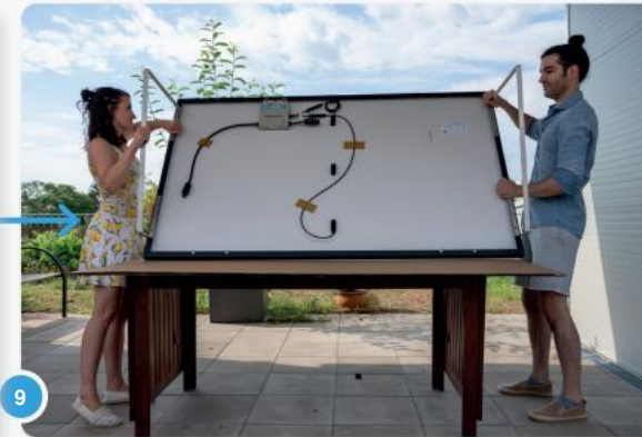
9 Nu kunt u uw paneel omdraaien...