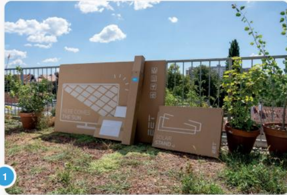
1 Paneel(en) inclusief omvormer en standaard.