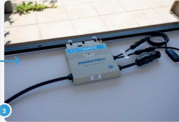
3 Plaats uw paneel(en) met de achterkant naar u toe op een schone, glatte ondergrond.