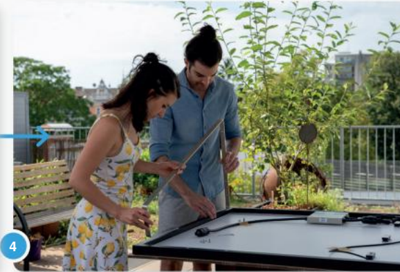
4 Aan de achterkant van het moduleframe vindt u gaten waar u de standaard kunt vastschroeven.