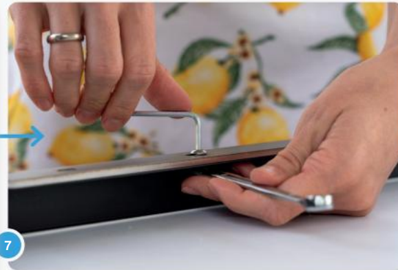
7 Nu kunt u de twee beugels met elk vier schroeven en moeren bevestigen.