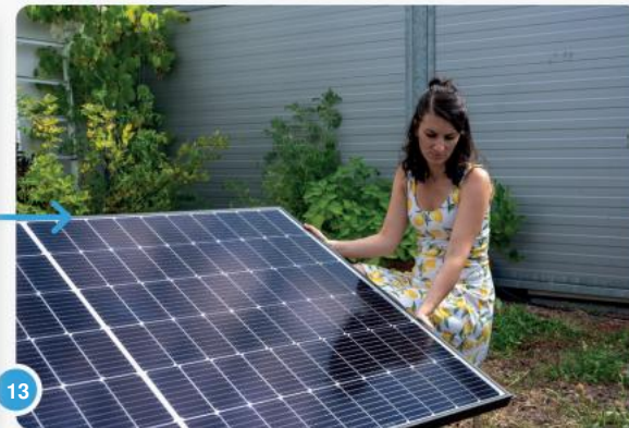
13 ...of je bevestigt je paneel met grondpennen aan de grond.