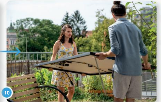
10 ...en draag hem naar een zonnige plek op je terras of in je tuin. Laat mij je hierbij helpen!