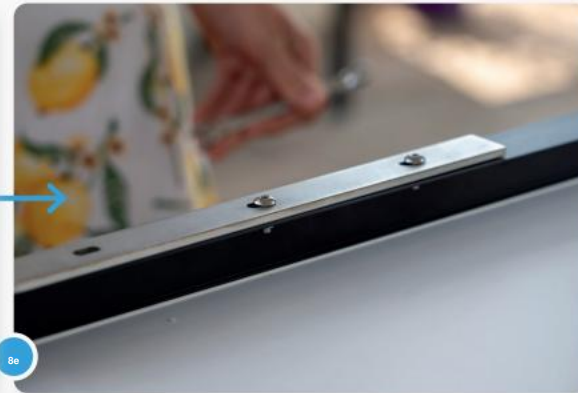
8 Het geheel zou er dan zo uit moeten zien.