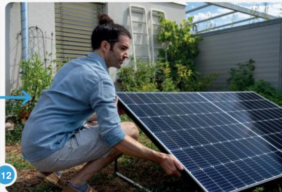
12 ...u kunt het paneel ook verzwaren met vier zichtbetonpanelen per beugel...