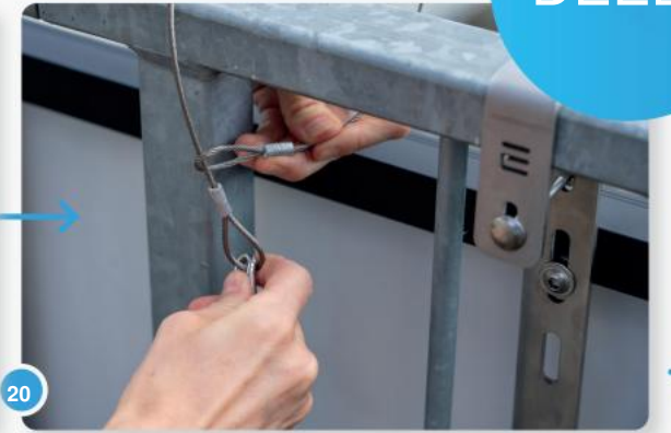
20 Bevestig nu het meegeleverde veiligheidstouw met een karabijnhaak aan het midden van de leuning en het paneel.