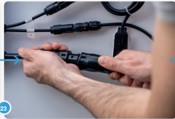
23 Als u voor LightMate G+ heeft gekozen, kunt u nu de twee omvormers met elkaar verbinden.