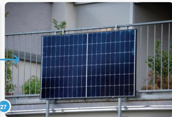
27 ...en geniet daarna van de groene stroom die je zelf opwekt!