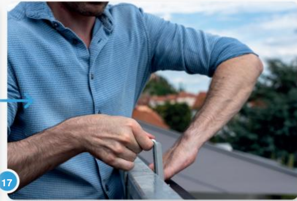
17 Laat het paneel voorzichtig zakken...