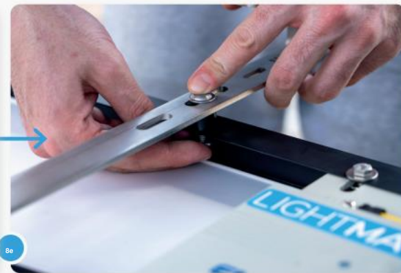
8 ...en steek de juiste schroef door het gat en de afstandshuls.