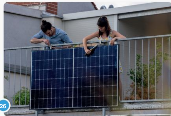
26 Nu kunt u alle schroeven nogmaals controleren en indien nodig vastdraaien...