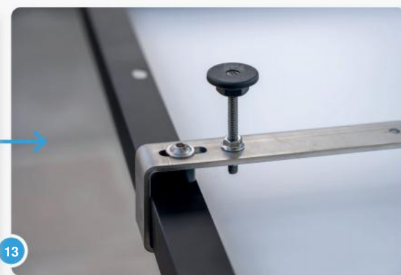
13 Dit is hoe het geheel eruit zou moeten zien.