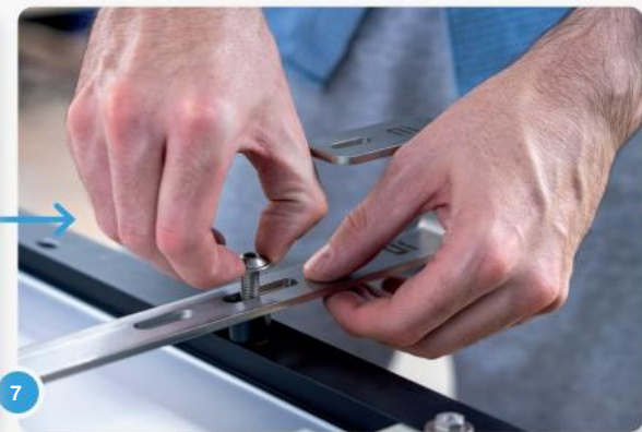
7 Plaats de zwarte plastic afstandshulzen tussen de haak en het moduleframe...