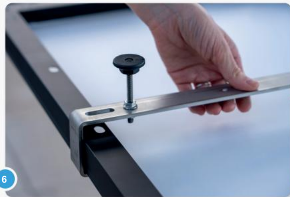
6 Steek het paneelframe in de onderkant van de haken.