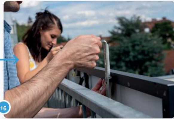
16 Hang nu de twee haken en het paneel aan de reling. Laat ons u hierbij helpen!