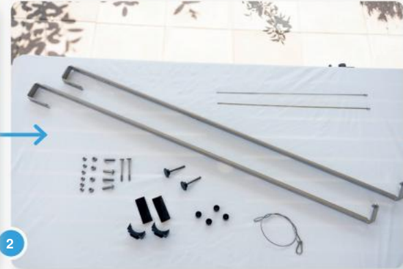
2 Onderdelen van de balkonhakenset.