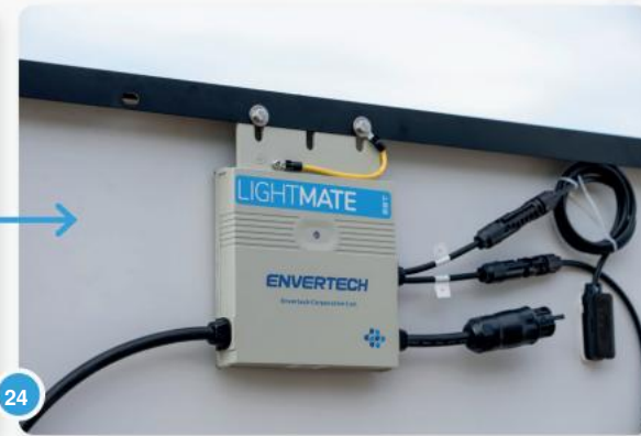
24 Wij leveren de omvormer al vastgeschroefd op het paneel.