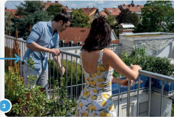
3 Bepaal eerst de positie op de balkonleuning of leuning.