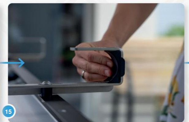
15 Als je een ronde leuning hebt, kun je de plastic bek in je haak steken.