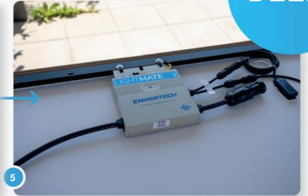
5 Plaats uw paneel(en) met de achterkant naar u toe op een schone, glatte ondergrond.