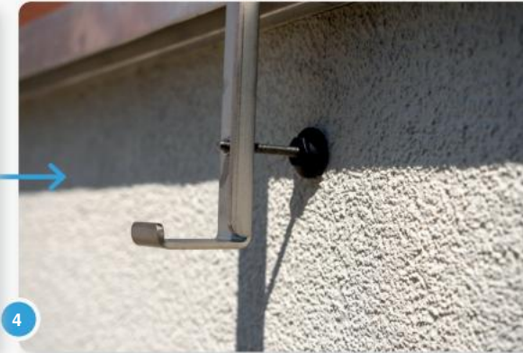
4 Om dit te doen, schroeft u het afstandstuk in een van de onderste drie gaten om de positie van het paneel uit te lijnen.