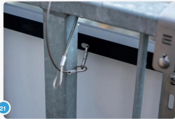
21 Zorg ervoor dat de sluiting van de karabijnhaak niet naar het moduleframe wijst.