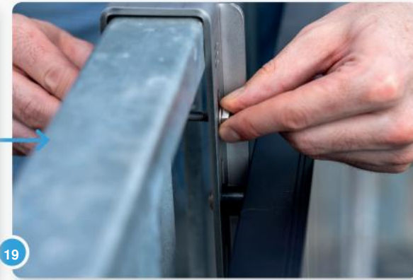
19 ...en draai hem handvast aan zonder de haken te buigen.