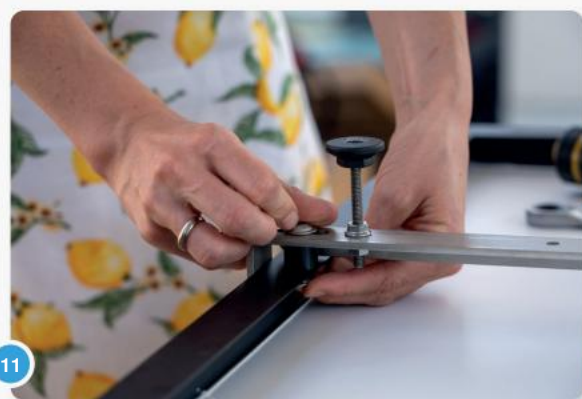
11 Herhaal nu het geheel aan de onderkant van de haken. Plaats de afstandshuls en schroef...