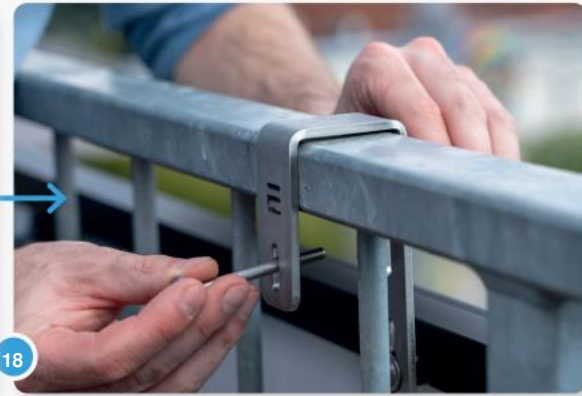
18 ...steek dan de lange schroeven onder de leuning...