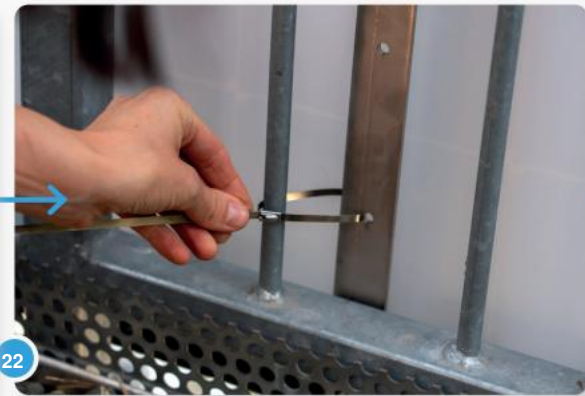
22 Nu kunt u de kabelbinders om het onderste uiteinde van de balkonhaken leiden. Bind ze zo strak vast dat het paneel niet meer kan zwaaien.