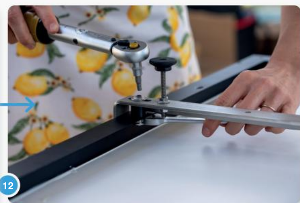
12 ...repareer het dan zorgvuldig. Let ook hier op het juiste aanhaalmoment (volgens de handleiding).