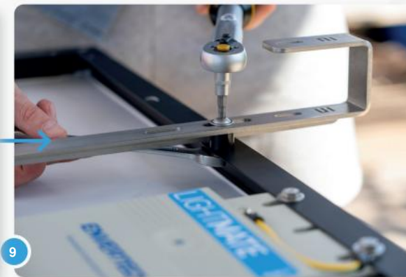
9 Bevestig vervolgens de haken aan het paneel met de schroeven en veiligheidsmoeren. Let op het juiste aanhaalmoment (volgens de instructies),