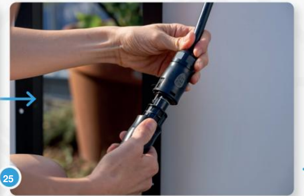
25 Vervolgens wordt het systeem via een stroomkabel op uw stopcontact aangesloten.